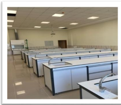
Tablo.3. Laboratuvar Bilgileri